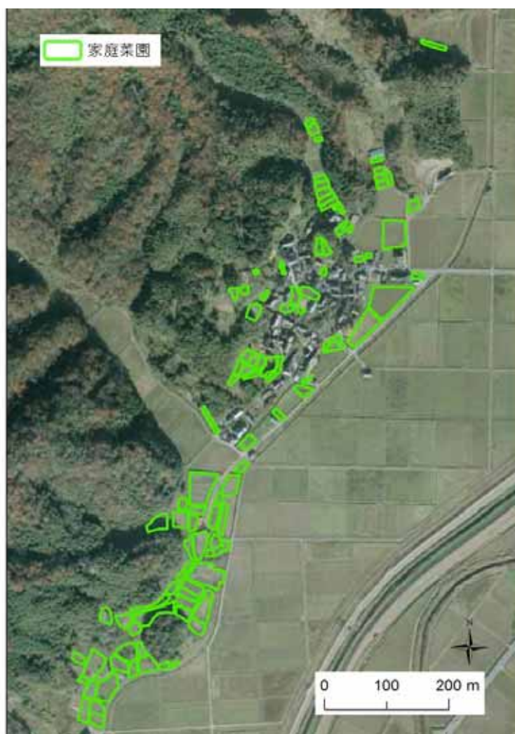
図 10-2 T 集落の地形および家庭菜園の位置

T 集落は山際に民家と小面積の農地があり、川沿いの平地に広い面積の農地が広がっている（図 10-2）。全 32 戸のうち農家戸数が 27 戸あり、84%にあたる。専業農家が数戸あり JA の直売所等に出荷しているが、全体としては自家用農家が多く、主な農作物は水稲、自家用の野菜である。集落営農組織や生産組合はない。城崎 A 群による出没は 1995 年頃から始まり、以後約 17 年間、自家用野菜等に対する被害を受けている。T 集落は、群れの遊動域の南部に位置しており（図 10-1）、およそ 1 年間に数回～十数回出没がある。出没が始まった当初は梨園を中心に被害が発生していたが、現在は、山際の菜園の野菜類が被害にあっている。