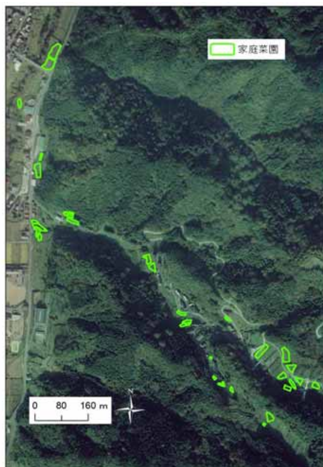
図 10-3 N 集落の地形および家庭菜園の位置

N 集落は人家も農地も山あいであり、広い平地はほとんどない（図 10-3）。集落戸数 17 戸の全戸が農地を所有しているが、専業農家はなく、ほとんどが自家用に水稻、野菜を栽培している。最近では 6 名でアサクラザンショウの生産組合を組織し、特産化を目指している。地域には昔からサルの群れが生息していたが、町が大型檻で大量捕獲を実施し個体数が減少したため、一時は被害が減少した。しかし、1992 年頃から現在の美方 A 群による出没が始まっており、N 集落は、群れの行動域の中央に位置している（図 10-1）。自家用野菜、大豆、小豆等に対する農作物被害が発生し、人家の屋根に上ったり、家屋内に侵入したりするなど、被害の深刻化に対応して、集落で追い払いを開始した。