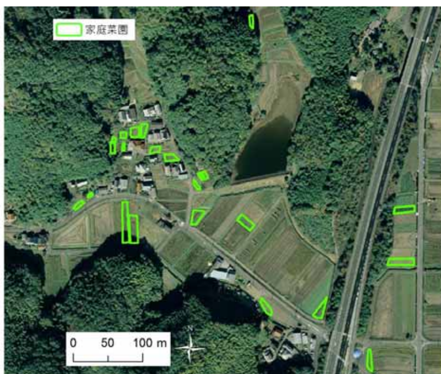
図 10-4 H 集落の地形および家庭菜園の位置

篠山市 H 集落は、篠山盆地の西縁部に位置し、県道が集落の中央部を東西に横断している。人家は集落の北側に集中している（図 10-4）。集落戸数 16 戸の全戸が農家であり、専業農家はいないが水稻や黒大豆（枝豆）を販売用に生産している農家が多い。共同利用型の集落営農組織があり、生産組合も存在する。篠山 A 群による出沒は 2004 年頃から始まり、自家用野菜に対する被害のほか、黒大豆などの換金作物への被害もある。集落は篠山 A 群の行動域の南西端に位置し、群れの出沒は県道より北側に限られる。