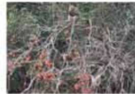
収穫しないカキの木に群がるサル