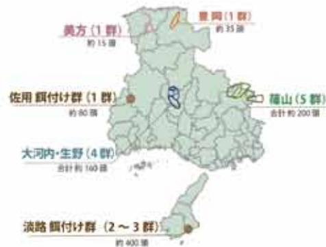
個体数調査および行動域調査 (2020年)

しかし、すべての群れが集落に出没し、農作物に被害を与えるなど、問題が起きています。