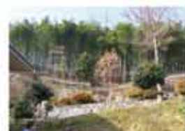
刈り払われた林縁部