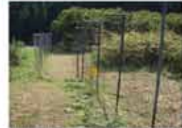
サルがよじ登ると感電する電気柵